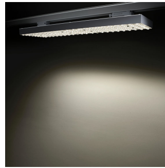
SM500T WB_VWB_DA20_DA35 Detail photo 17