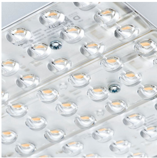
SM500T DA20-WB Detail photo 05