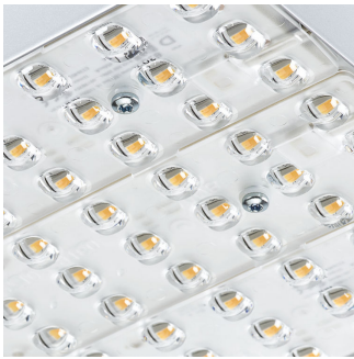
SM500T WB_VWB_DA20_DA35 Detail photo 07