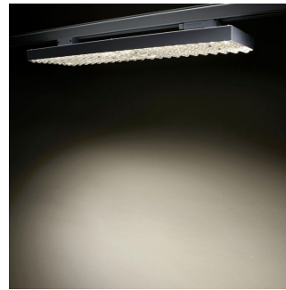
SM500T DA20-WB Detail photo 15