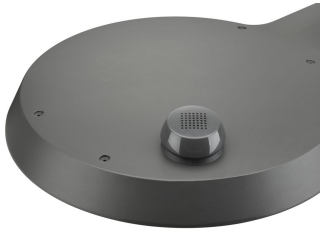
TownTune ASY BDP265