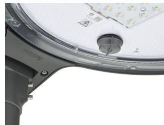
TownTune ASY BDP265