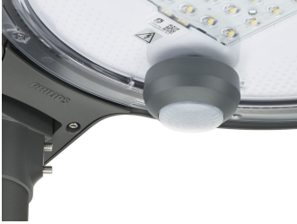
TownTune ASY BDP265