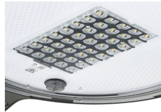
TownTune ASY BDP265