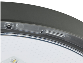
TownTune ASY DR BDP266