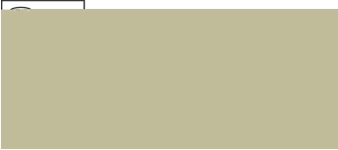
TownGuide Performer BDP100-105