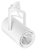
ST321T - GreenSpace Accent Projector 3C white