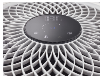
UVCA200 UV-C Floor standing air unit