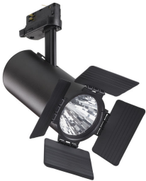
ST315T BK Greenspace accent Projector mini + ST710Z BD BK Barndoor