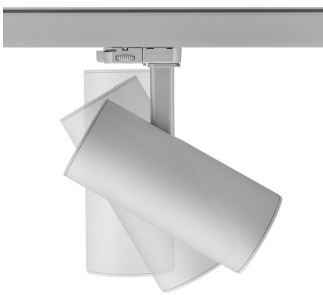
ST315T PSU SI Greenspace Accent Projector mini side view