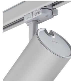
ST315T PSU SI Greenspace Accent Projector mini back view hinge detail