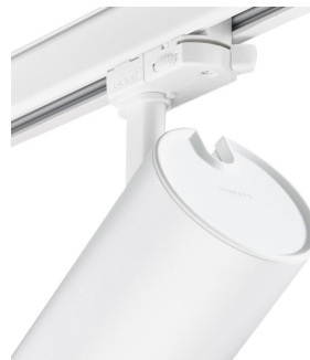
ST315T PSU WH Greenspace Accent Projector mini back view hinge detail