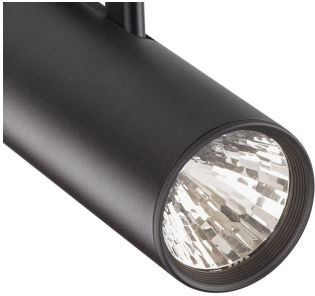
ST315T PSU BK Greenspace Accent Projector mini lens detail