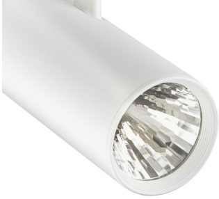
ST315T PSU WH Greenspace Accent Projector mini lens detail