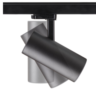
ST315T PSU BK Greenspace Accent Projector mini side view