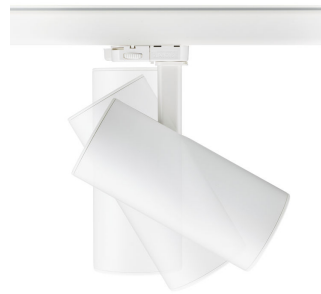
ST315T PSU WH Greenspace Accent Projector mini side view