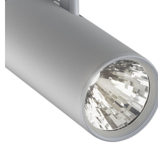
ST315T PSU SI Greenspace Accent Projector mini lens detail