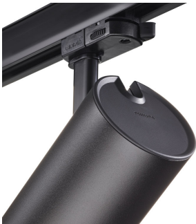
ST315T PSU BK Greenspace Accent Projector mini back view hinge detail