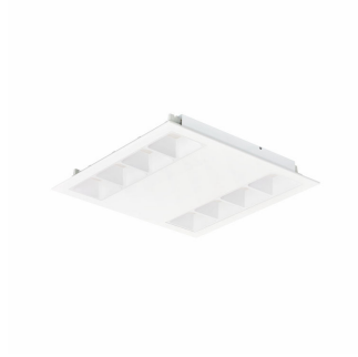
PowerBalance gen2 RC360B uppoasennettava, neliö