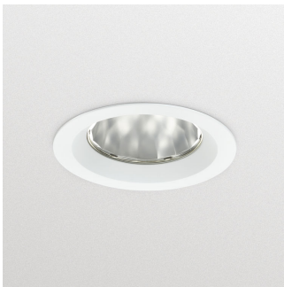
GreenSpace Accent Fixed