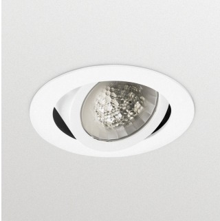
LuxSpace Accent Compact G3 - LED Module, system flux 1700 lm