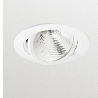
LuxSpace Accent Performance G3 - LED Module, system flux 2700 lm