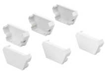
Coreline trunking gen2 end cap