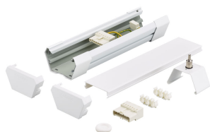
Ordercode 910925867562, 910925867563