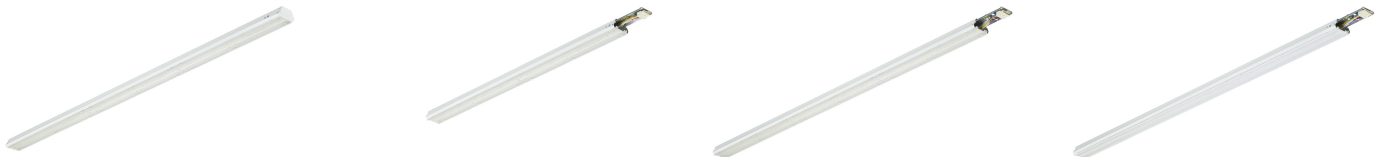
Coreline Trunking Gen2 - 84°